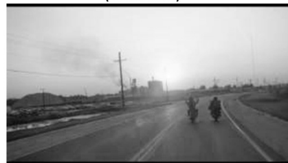
(d) ...kündigt das Ende der Reise an. (01:31:05)