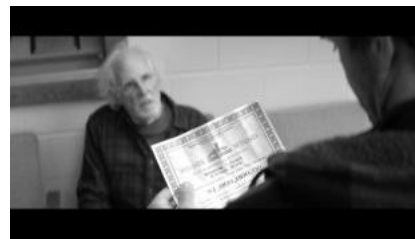
(b) vermeintlicher Lotteriegewinn (00:04:07)