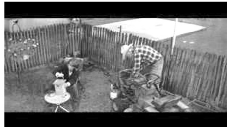
(b) eingeengt im Garten (00:13:55)