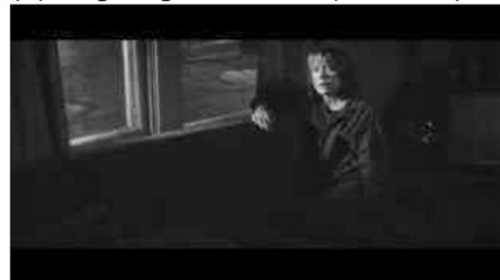
(d) Rose blickt auf (00:17:57)