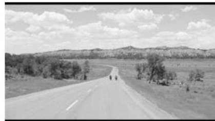
(b) ... inmitten der grünen Landschaft. (00:53:06)