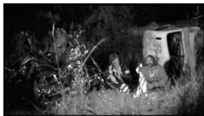
(a) Motorrad vs. Truck (00:10:16)

Es wird der Frontier-Mythos bestätigt, indem die ästhetische Überhöhung der unberührten Landschaften im Südwesten als traditionell nationalistischer Diskurs fortgesetzt wird und der die Staaten als Land der unbegrenzten Möglichkeiten und Freiheit begreift. Dabei nimmt der Film eine starke geografische Wertung vor. Der Westen und der Südwesten werden idealisiert als Orte der Freiheit, Schönheit und spiritueller Erneuerung. Der Süden und seine Zivilisation hingegen werden dämonisiert als Ort von Rassismus, Intoleranz und Gewalt. Der Film nutzt dann alte amerikanische Heldenbilder, um die Hauptfiguren zu erweitern. Es wird das Bild des Hippies als neuer Pionier erschaffen. Dies zeigt sich dann auch an der Kleidung der Figuren. Billys Kleidung mit seinem Wildleder erinnert an das Bild des Trappers, dies wird der moderneren schwarzen Ledertracht Wyatts gegenübergestellt. So präsentieren sich Wyatt und Billy als Hippies besonderer Art, Wyatt als cooler existenzialistischer Typus, Billy als wild und paranoid. 46