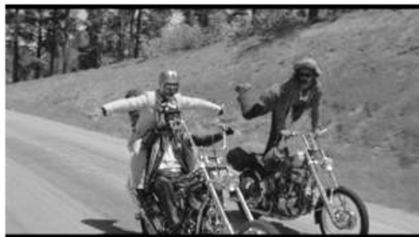
(a) Noch gänzlich unbefangen... (00:52:36)

Es erfolgt erneut ein abrupter Szenenwechsel. Wyatt und Billy haben endlich ihren Zielort, New Orleans, erreicht. Sie befinden sich in einem Bordell, welches durch eine sehr auffällig sakrale Einrichtung ins Auge sticht. Womöglich handelt es sich um ein ehemaliges Gotteshaus. Frauen tanzen dort auf Tischen, es wird Alkohol konsumiert und das ganze Geschehen wird durch eine psychedelisch-rockartige Version von „Kyrie Eleison“ von The Prunes begleitet. Die Kamera wechselt zwischen Detailaufnahmen von Gemälden mit religiösen Motiven. Sie nehmen zwei Frauen mit zum eigentlichen Festumzug. Dort findet noch ein auffälliger Wechsel der Kameraoptik statt. Die Szenen wurden im 16 mm Format per Handkamera gefilmt und unterstreichen die Nähe zum Experimentalfilm durch die instabile Bildführung und das grobkörnige Bild. 53 Dies illustriert zum einen die Abwendung vom klassischen Hollywood-Kino und zum anderen verstärkt es die fremdartigen ekstatischen Eindrücke des zunehmend eskalierenden Drogentrips. Dort findet sich auch der erste Einsatz von intradiegetischer Musik und trotz der bunten Zusammensetzung von Menschen gerät Billy fast in eine Auseinandersetzung. Selbst als Teilnehmer eines Festumzugs scheint die Gruppe herauszustechen. Der Höhepunkt der Ekstase wird dann auf dem Friedhof erreicht, wo sexueller und drogengestützter Exzess mit sakraler Symbolik zusammenfallen.