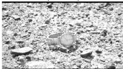
(c) Abkehr von der Gesellschaft (00:07:07)