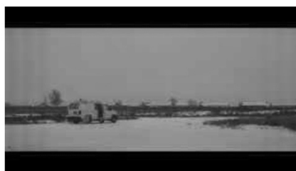
(a) Aufbruch am Morgen (00:16:58)

grauen Farbtönen einen frostigen Eindruck hinterließen, erreicht sie eine beige Step- penlandschaft. Zusammen mit dem hellblauen Himmel entsteht ein Eindruck von Wärme, der durch den Wechsel der extradiegetischen Musik verstärkt wird. Anstelle von „elegisch-melancholische[r] Traurigkeit“ 87 ist nun zurückhaltende Euphorie zu ver- nehmen. So korrespondiert der Landschaftswechsel mit dem Treffen der Communitas. Fern wird beim Eintreffen vom Beifahrersitz aus von der Kamera eingefangen. Sie scheint zunächst noch unsicher zu sein, ihre Mimik ist noch gleichgültig. Sie steigt aus und erreicht kurzerhand die Gruppe von Menschen.