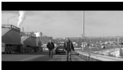
(a) Woody zu Fuß (00:01:10)

Sohn einen Teil dieser Fähigkeiten vermittelt. Nun wird das Bild der elterlichen Fürsorge und Vorbildfunktion umgekehrt: Ross verhindert, dass Woody sich und andere durch eine Irrfahrt in Gefahr bringen kann, David führt diese Aufgabe durch seine Teilnahme am Roadtrip fort. Dennoch ist Woody nicht gewillt, aufzugeben. Ähnlich wie in The Straight Story ist Starrsinn eines von Woodys wesentlichen Charaktermerkmalen. David nimmt eine genau gegenteilige Rolle ein. Sein Leben wird von durch Ziellosigkeit definiert. Sein Job wird als wenig erfüllend dargestellt, seine Freundin verlässt ihn, weil er keine Entscheidung treffen kann. Dies wird noch dadurch unterstrichen, dass sein eigener Bruder gerade eine Beförderung als News Anchor erhalten hat. Es wird also zwischen Vater und Sohn eine Buddy-Movie Dynamik geschaffen, die mit der Familien-Thematik kombiniert wird.