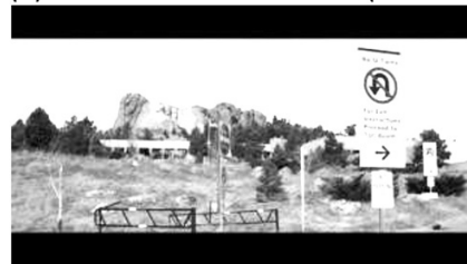
(d) Kritik des Monuments (00:17:35)