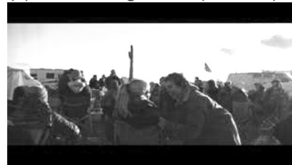
(d) Treffen der Nomaden (00:18:32)