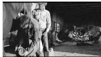
(b) Motorrad - Pferd (00:13:53)