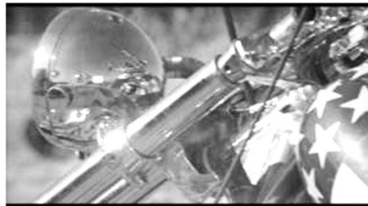
(a) Überhöhung des Motorrads. (00:06:25)

know I've smoked a lot of grass, O Lord, I've popped a lot of pills“ begleiten die Aufnahme. Die Kamera changiert dabei zwischen scharf und unscharf und scheint die Wirkung der besungenen Drogen zu versinnbildlichen, während der Songtext von einem Dealer handelt, der den möglichen Tod seiner Kunden mit absoluter Teilnahmslosigkeit behandelt.