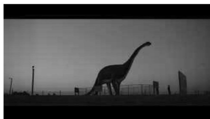
(a) Fern, als winzige Silhouette (01:05:49)