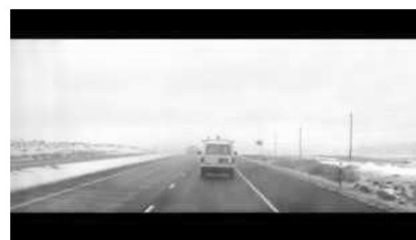
(b) Fahrt ins Ungewisse? (00:17:26)