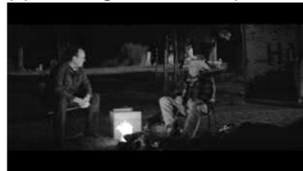
(d) Gespräch mit Pfarrer (01:33:29)