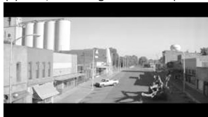
(c) Laurens - dörfliche Idylle (00:03:06)