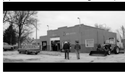
(d) ehemalige Arbeitsstätte (00:30:17)