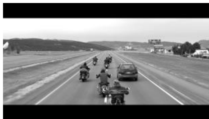
(a) Filmverweis auf Easy Rider? (00:17:07)

hat. Die nächste Szene scheint ein weiteres Filmzitat aus Easy Rider zu sein. Das Austreten am Fahrbahnrand erinnert sehr stark an die vergleichbare Szene dort. Ein Motiv welches auch in Nomadland zitiert wird. Die erste Nacht am nächsten Transitort dem ‚Stardust Motel‘ ist allerdings mit Gefahr für Woody verbunden und stellt somit einen Rückbezug zu früheren Roadmovies dar, in denen Transitorte Spannung generieren. Er stürzt nachts und muss aufgrund einer Platzwunde ins Krankenhaus.