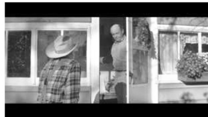
(b) Einladung ins Wohnhaus (01:09:50)