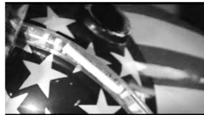
(b) Metonymie von Geld und Freiheit (00:05:41)