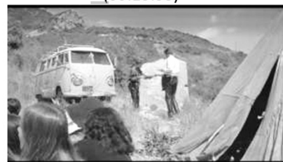
(d) Hippie Kommune (00:36:12)