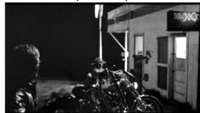
(d) Ablehnung am Motel (00:09:51)