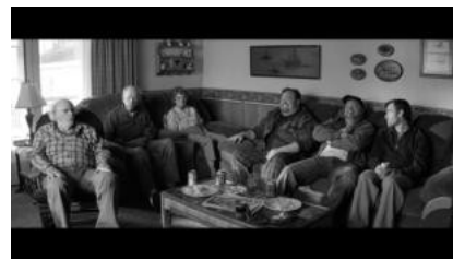
(b) Dialog zum Reisetempo (00:28:51)