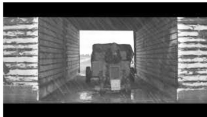
(a) offener Unterstand (00:51:48)

schnell zu fassen und beginnt die Reparatur. Während des nächtlichen Sturms erhalten Alvin und Rose Nachricht von dem kranken Bruder, was Alvin erheblich zusetzt. Am nächsten Tag ist Alvin beim Mähen im Garten zu beobachten, sodass inferiert werden kann, dass die Instandsetzung geglückt und seine Beharrlichkeit zurückgekehrt ist. Am Abend wird deutlich, dass Alvin ebenfalls für eine Zeit ein Leben auf Reisen verbracht haben muss und sich nun entschließt, seinen Bruder zu besuchen: „Rose, I’m gonna go back on the road. I’ve gotta go see Lyle.“