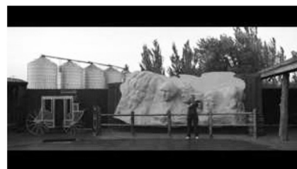
(b) Selfie und Filmreferenzen (01:06:06)